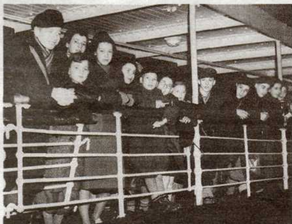
200 jüdische Flüchtlingskinder aus Deutschland kommen in Harwich/England an.

Franklin, geboren 1940 in Montevideo, verdankt seinen Namen dem Umstand, dass seine Mutter Heidemarie, eine 1938 aus Österreich vertriebene Jüdin, den US-amerikanischen Präsidenten Franklin D. Roosevelt als große Persönlichkeit schätzte. Dies hielt sie mittlerweile für einen bitteren Irrtum, denn, wie sie aus nordamerikanischen Zeitungen nach dem Krieg erfahren habe, sei Roosevelt nicht daran interessiert gewesen, Juden in die USA zu lassen. Roosevelt, auf einer Pressekonferenz wenige Tage nach dem Novemberpogrom zu einer Lockerung der Einwanderungsgesetze befragt, erklärte: „Das steht nicht zur Debatte. Wir haben unser Quotensystem.“ Gisela selbst war nach Chile geflohen und später weiter nach Uruguay emigriert. Ihren Eltern aber wurde, so erzählt sie, die den US-Konsulaten auftragene Verzögerungstaktik bei der Ausstellung von Einreisevisen zum Verhängnis. Obwohl sie über die obligatorischen Bürgerschaftspapiere verfügt hätten, habe man sie hingehalten, bis es zu spät gewesen sei. Schließlich wurden sie nach Theresienstadt deportiert und ermordet.