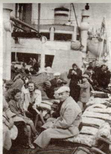
Deutsche Flüchtlinge auf der Flucht in die USA, 1939

drastisch radikalisiert wurde. Einen traurigen Höhepunkt erreichte diese Entwicklung mit der „Reichskristallnacht“. 1933 mussten rund 38.000 Juden Deutschland verlassen, in den folgenden Jahren waren es etwas weniger, jeweils zwischen 20.000 und 25.000.