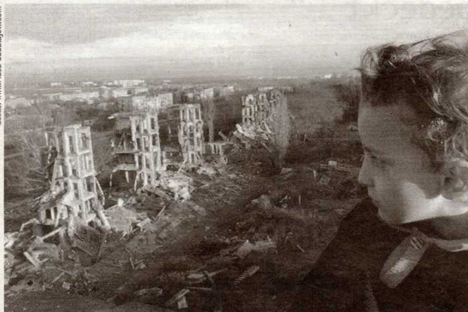
Drei Kilometer vom Zentrum Grozny entfernt traf Sadulajew auf in den Trümmern spielende Kinder.

Tschetschenien-Komitee: „Tschetschenien – die Hintergründe des blutigen Konflikts“ Diederichs Verlag 2004.