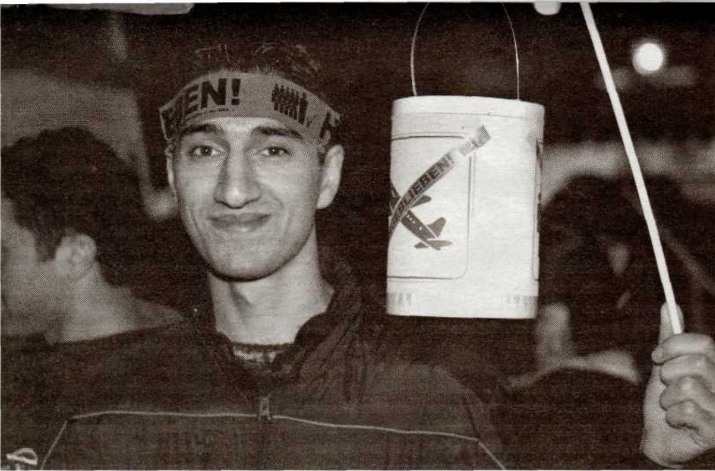
Auf einer Demonstration für das Bleiberecht