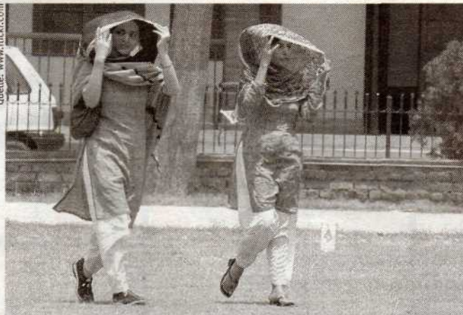
Pakistannerinnen, die nach Indien fliehen, erhalten kein Asyl und werden ausgeliefert.