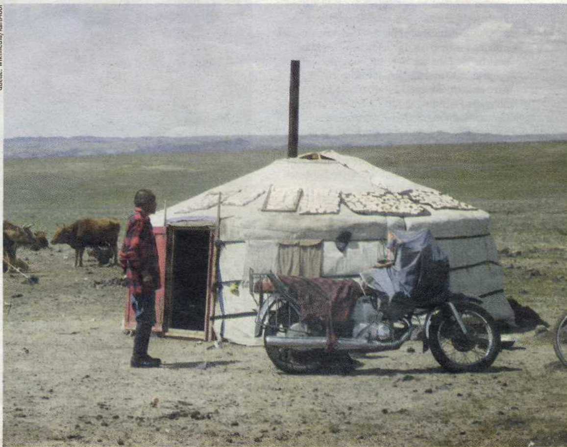
Mongolischer Nomade vor seiner Jurte. Die mongolische Regierung will, dass die Nomaden in die Stadt ziehen.

neue funktioniert. An den Grundbedürfnissen wie nach Energie, Luft, Trinken und Essen kommt man nicht vorbei. Diese sollten weltweit vom Staat und nicht von Konzernen befriedigt werden. Ich bin auch ein Befürworter eines bedingungslosen Grundeinkommens von Geburt an. Lohnsklaverei entfällt und damit die Debatte um Mindestlöhne. Wer nicht für seinen Lebensunterhalt arbeiten muss, kann zu einem Sklavenlohn „Nein!“ sagen. Dann entfällt auch, wirtschaftliches Asyl zu suchen.