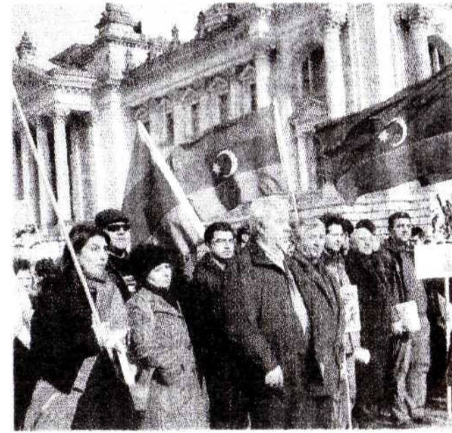
Berlin'de Hocaali Katliamı'nda ölenler için sa

etmesi, katliamı yapanların uluslararası mahkemelerde yargılanması ve Karabağ'dan sürülen Azerilerin ana vatanlarına dönmelerinin sağlanması gerektiğini belirtti. Delbasteh, 25 ve 26 Şubat 1992'de Ermeni birliklerinin yaptığı katliamda masum insanların öldürüldüğünü kaydetti. Katliamı gözler önüne seren fotoğrafların taşındığı gösteride, katledilen yaklaşık 600 kişi için saygı duruşunda bulunuldu.